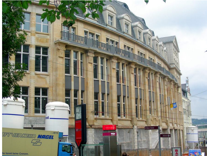
Die sanierte denkmalgeschützte Ansicht am Parkplatz