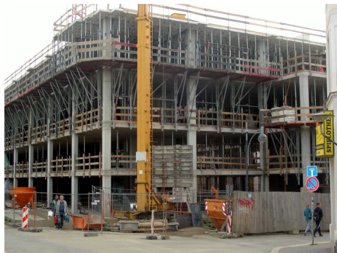
Bauarbeiten am Neubau Ecke Rädelsstraße/ Forststraße